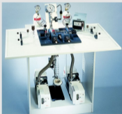
MANIFOLD AND COMPLETE PUMPING SYSTEM 全套充气真空设备